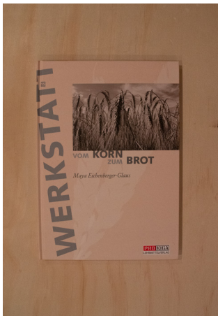
Vom Korn zum Brot - Maya Eichenberger-Glaus 1. Zyklus

Sammlung an Werkstattaufträgen im Postensystem zu verschiedenen Themen (Korn/Mehl/Brot), die Posten sind sowohl aus Arbeitsblättern wie praktischen Handlungsaufträgen zusammengestellt, Ideen für die Getreidemühle sind ebenfalls vorhanden