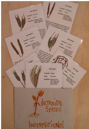
Getreidesorten - Infos

2 x Handzeichnungen von Getreidepflanze & -Korn inkl. Lösungsblätter