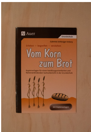
Vom Korn zum Brot - Gabriela Schlesinger-Imbery 2. Zyklus

Sammlung an Werkstattaufträgen im Postensystem zu verschiedenen Themen (Korn/Mehl/Brot), die Posten sind sowohl aus Arbeitsblättern wie praktischen Handlungsaufträgen zusammengestellt, Ideen für die Getreidemühle sind ebenfalls vorhanden